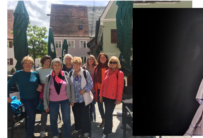
Ausflug ins Textilmuseum nach Mindelheim